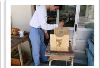
作業学習（クラフト）