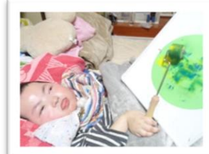
家庭での授業 （中学部）