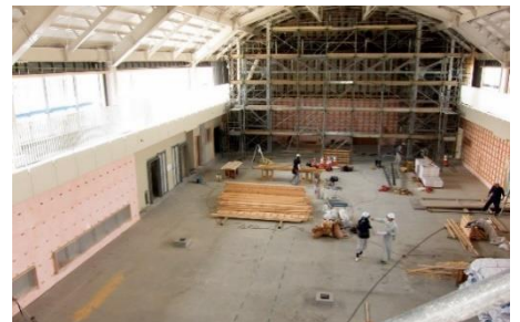
体育館内部の工事の様子