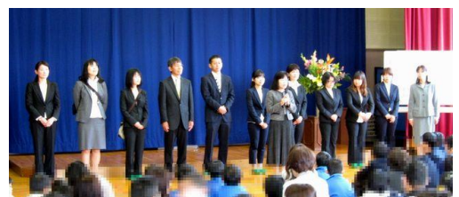
退任された先生方