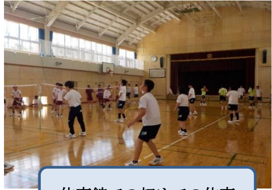
体育館での初めての体育

1 階には調理場や食堂、高等部の作業室（布工班・紙工班・エコクリーン班・食品加工班）ができました。9 月に入り、新築のにおいのする作業室での授業がいよいよ始まりました。2 学期最初の作業学習では、旧作業場所から荷物を運んだり使用の決まりを確認したり期待が高まりました。新しい教室での授業は特に気合いが入ります。掃除にもいつも以上に磨きがかかりました。