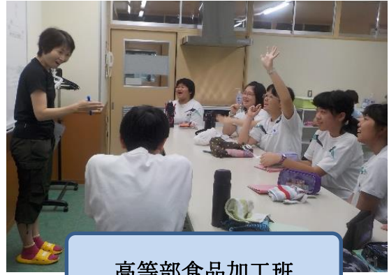
高等部食品加工班