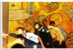
西支援祭（ステージ発表）