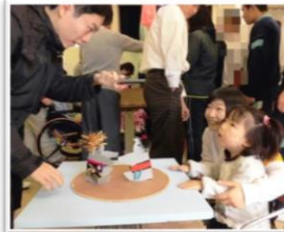
西支援祭（とんとん相撲）