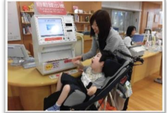
校外学習（県立図書館）